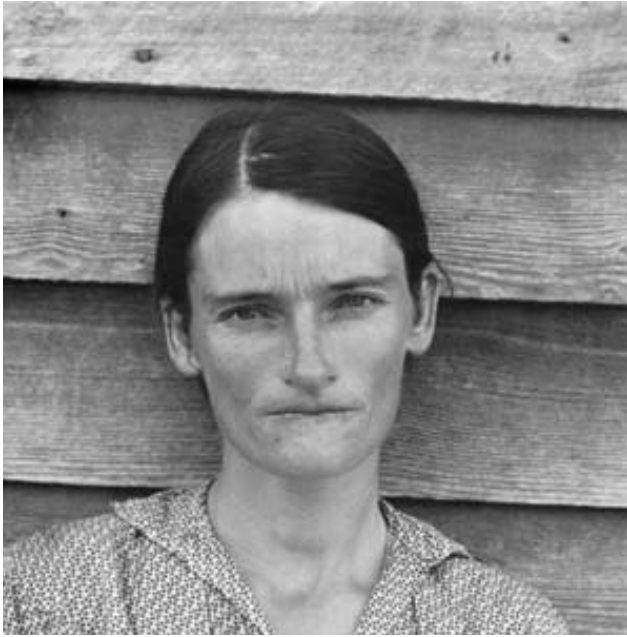
The Burroughs , W. Evans, 1936